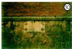
FRANCO DONATO MURUS AFUNDA GENTIS RESTITU

L'epigrafe riportata è sulla cortina, tra il baluardo n° 4 (Feltrino) e il baluardo n° 5 (Tognon), costruita sotto il dogato di Francesco Donato (foto n° 10). Quando Nicolò Querini, rientrato in Senato il 20 aprile 1554, relaziona sulla situazione lasciata a Peschiera, i 5 baluardi sono tutti fondati fino al cordone. Restano da terminare la porta verso Verona e le cortine; inoltre non bisognerebbe ritardare ancora l'inizio del lavoro di terrapieno della vecchia rocca per farne un potente cavaliere secondo "il disegno di sua eccellenza il Duca di Urbino" . Alla morte del Doge Marcantonio Trevisan, nel 1554, viene nominato LXXXI Doge Francesco Venier. Il 21 gennaio 1555 il Senato di terra, a causa della morte dell'ingegnere Antonio Saracino, avvenuta in Peschiera, provvede a decretarne la sostituzione proponendo l'ingegnere Francesco Malacreda. E' questo un brutto periodo per i Dogi Veneziani, perché nel 1556 muore anche Francesco Venier. Gli succede, come LXXXII Doge, Lorenzo Priuli. Nell'anno 1555 il provveditore di Peschiera è Giacomo Gauro, che ha sostituito Nicolò Gabriel. Anche il suo nome appare, come quello dei predecessori, su una lapide che viene murata sulla facciata di un edificio pubblico in piazzetta Arilicense (foto n° 11). Lo stemma gentilizio di Giacomo Gauro viene posto invece sull'ultimo fornice a destra dei Voltoni, se lo si osserva dall'isolotto dei terrai, oggi chiamato isola del Mandracchio. E' visibile solamente in barca (foto n° 12).