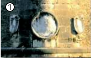
FRANC. GENO. PROV. ET PRAEF. SUB. PRINC. SEREN. FRANC. DONATO ANNO MDLI